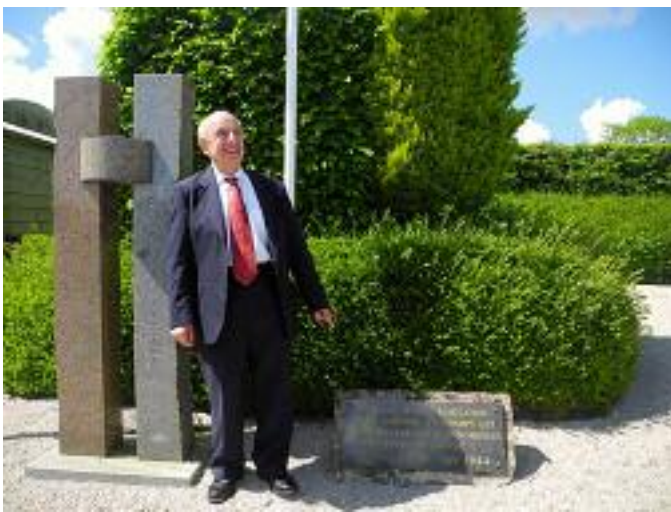
Rencontre avec monsieur Guy Stern vétérans américain, il débarqua le 9 juin 1944 à Utah Beach et officia au camp de prisonniers de Foucarville.