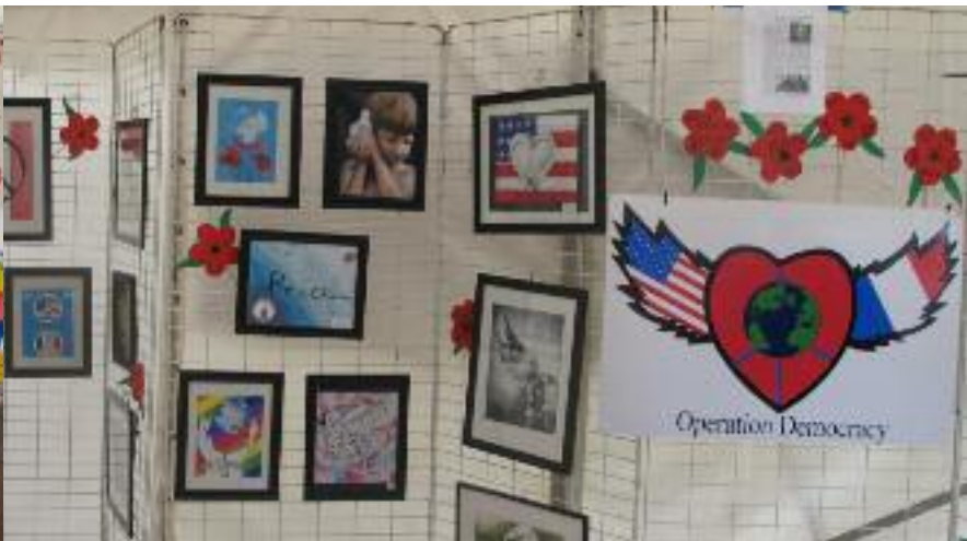
Expo sur le thème de la Liberté.