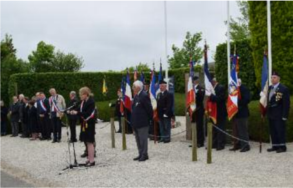
Commémoration à la stèle du camp de prisonniers de Foucarville en présence des autorités allemandes, américaines et françaises.