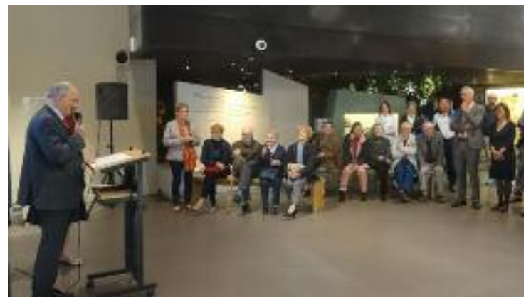
Inauguration le 13 mai de l'exposition sur le camp de prisonniers allemands à Foucarville de 1944 à 1947 qui se tiendra jusqu'au 15 octobre 2016 au